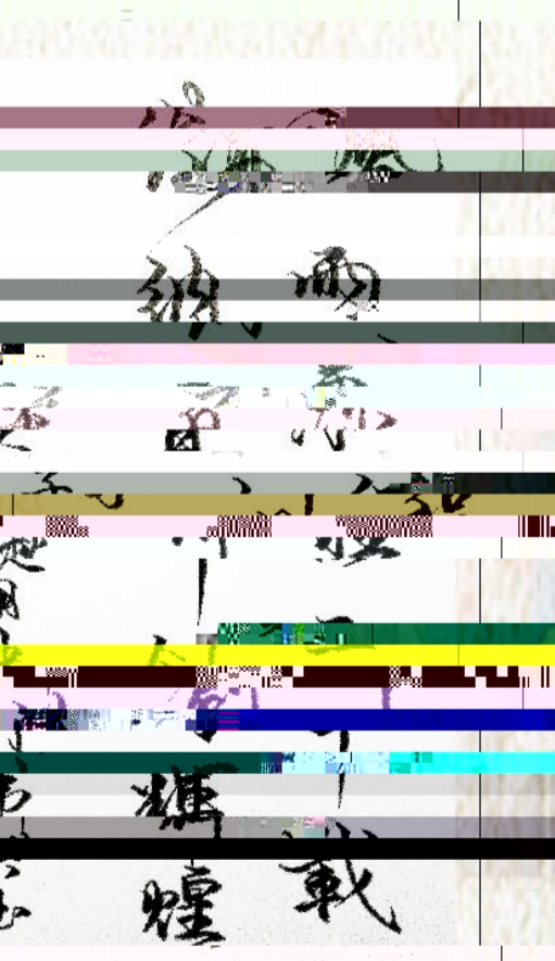
中洲公司 郭伟东作

我去2000年，去看看那时的桐昆报。我去2000年，去看看那时的桐昆报。我去2000年，去看看那时的桐昆报。 我去2000年，去看看那时的桐昆报。我去2000年，去看看那时的桐昆报。我去2000年，去看看那时的桐昆报。 我去2000年，去看看那时的桐昆报。我去2000年，去看看那时的桐昆报。我去2000年，去看看那时的桐昆报。